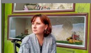
Тоня Шилулина Детский писатель, иллюстратор